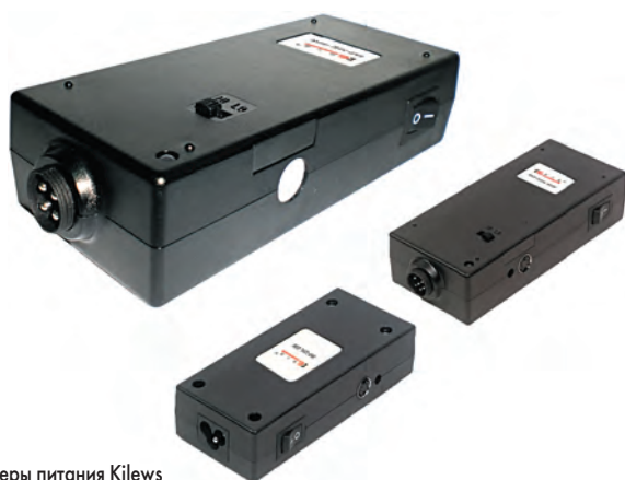
Рис. 2. Силовые контроллеры питания Kilews

Винтоверты с питанием переменным током наиболее просты и надежны. Питание их осуществляется непосредственно от сети переменного тока с напряжением 220–240 В, 50/60 Гц. Все винтоверты оборудованы постоянным заземлением через 3-проводной шнур питания.