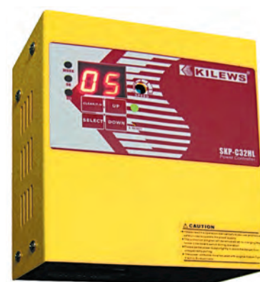
Рис. 3. Силовой контроллер SKP-C32HL

Помимо стандартных силовых контроллеров питания компания Kilews производит различные контроллеры, расширяющие функциональные возможности инструмента. Например, при использовании контроллера плавного старта появляется возможность пуска винтоверта с начальной фазой пони-